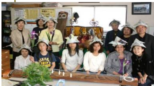
美食, 让您欢渡一个有趣的节日。

本中心的日本语教室, 通过日本的传统行事、希望外国籍朋友, 接触日本文化, 借着节日庆典开办各种活动。5月、以前传流为男孩子的节日『端午の節句(现在为“子どもの日”)』庆祝此节日。一开始琴的演奏、折新闻做日本以前小孩子戴的头冠(兜)、尝吃日本风味的和式点心(柏饼)、玩以前日本的游戏(あみだくじ)虽然活动在短时间结束, 但却是一个充实有意义的时刻。在7月、每年举行「七夕祭日」正在企画中, 将是一个怎样的演出? 请热烈期待。平常没有参加日本语教室的外国籍朋友, 欢迎您的加入。可一边学习日本语一边品尝。