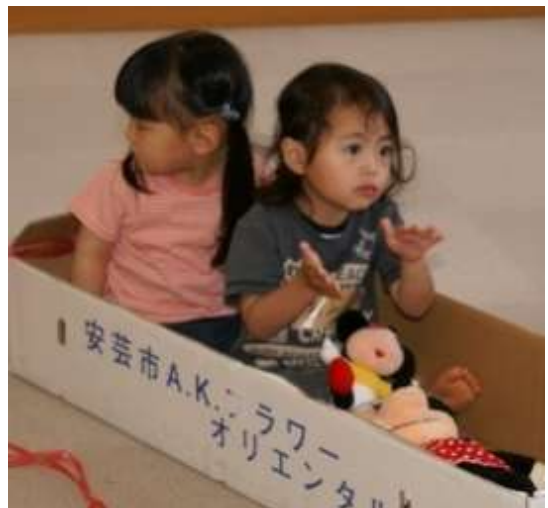
전회 실시한 「골판지를 이용해 놀자」