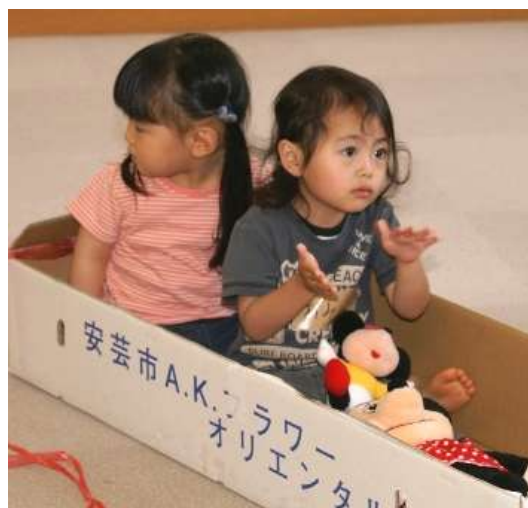
"Laruang gawa sa kahon" kuha noong nakaraan

SUMALI sa *** "International Cultural exchange forum" sa Fujimi-shi"