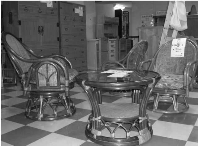
▲Local de exposição de usados p/sorteio 16 de cada mês

☆Recycle Plaza Risaikan Fujimi-shi Oaza Katsuse 480 Tel.&Fax 049-254-1160