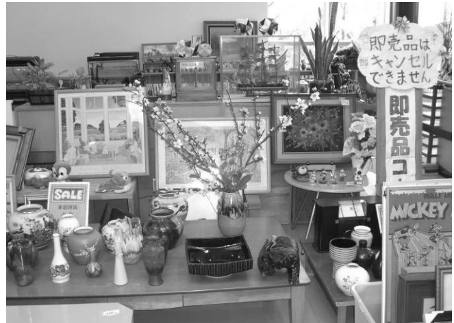
▲Venda à pechincha