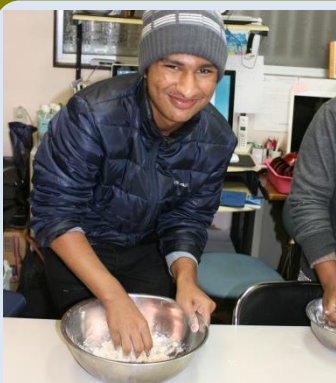
12月22日、举行了 体验制作荞麦面