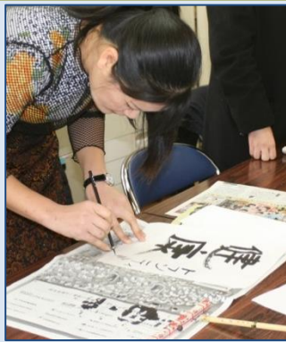
1月12日、举行了新 年开笔